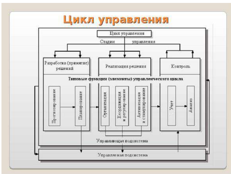
Схема - это условное изображение какого-либо процесса, разделение его на отдельные функциональные элементы и обозначение логических связей между ними. Использование схемы как оценочного средства позволяет увидеть насколько обучающийся понимает суть изучаемых явлений и процессов, видит структурные и функциональные составляющие, а также умеет правильно определять существенные связи, зависимости, отношения между элементами.

Проанализировать функции управления организацией: содержание и управленческие инструменты