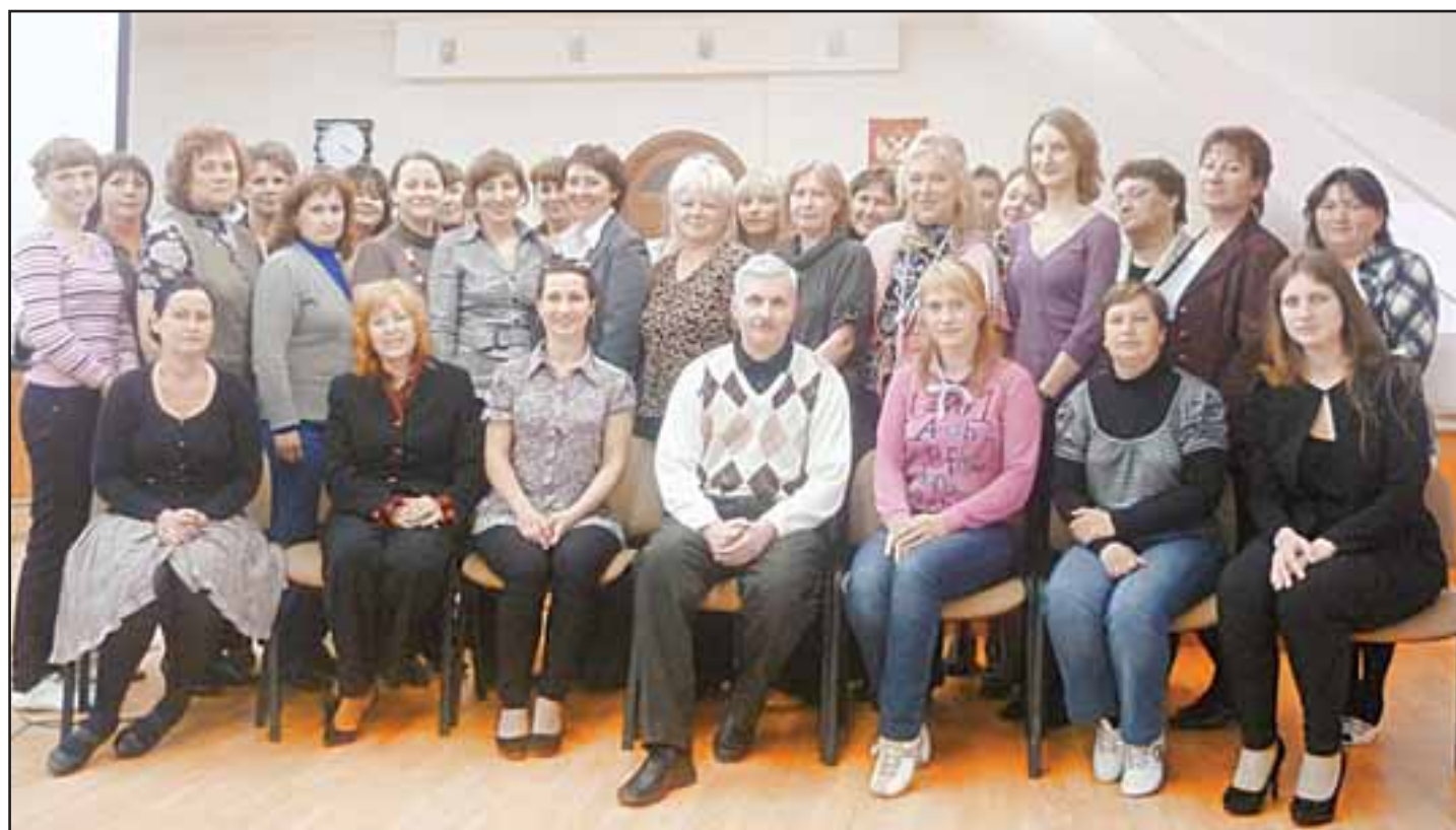
Вручение удостоверений слушателям КПК «Профилактика и коррекция асоциального поведения детей и подростков»