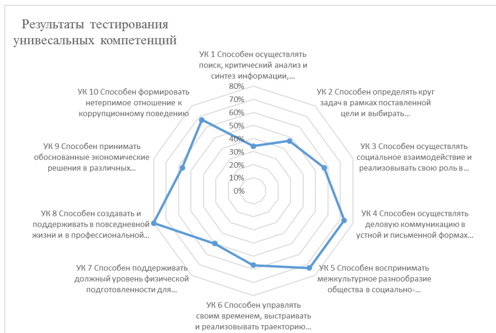
Рис 1. Итоги тестирования универсальных компетенций студентов

Результаты тестирования уровня сформированности универсальных компетенций студентов показывают, что наиболее развиты у студентов компетенции, связанные со способностью поддерживать в повседневной жизни и в профессиональной деятельности безопасные условия жизнедеятельности для сохранения природной среды, обеспечения устойчивого развития общества, в том числе при угрозе и возникновении чрезвычайных ситуаций и военных конфликтов; компетенции, связанные со способностью воспринимать межкультурное разнообразие общества в социально-историческом, этическом и философском контекстах; компетенции, связанные с нетерпимым отношением к коррупционному поведению.