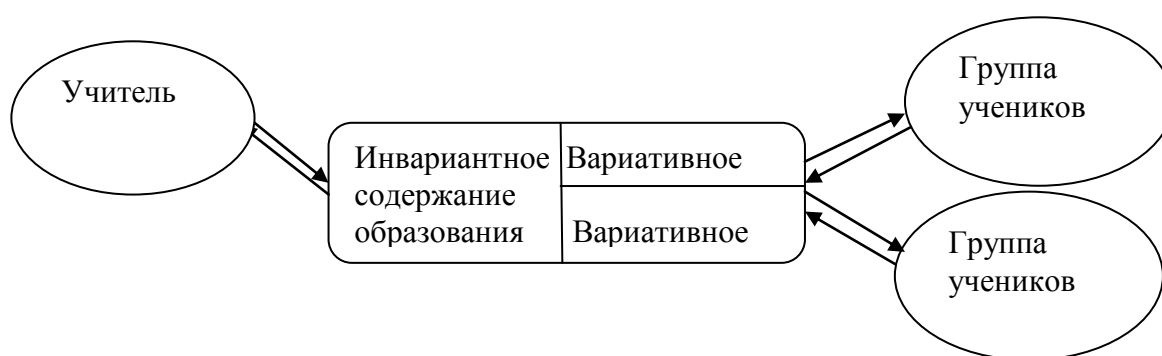
Рисунок 2. Модель дифференцированного обучения

В условиях дифференцированного обучения базовая модель изменяется и представленный на рисунке 2. В модели дифференцированного обучения единое содержание образования разделяется на инвариантное, подлежащее усвоению всеми учащимися, и вариативное, ориентированное на интересы, способности, склонности групп учеников (или отдельного ученика в предельном случае дифференциации – индивидуализации). Взаимодействие учителя и ученика остается тем же, и осуществляется через содержание образования.