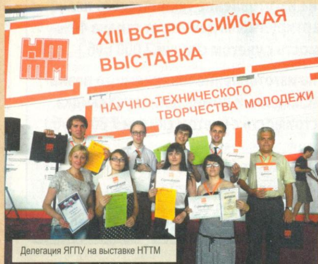
Делегация ЯГПУ на выставке НТТМ