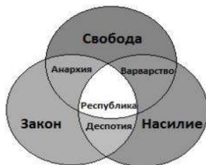
Рисунок 8 – Формы государства по И. Канту 1

Правильным будет указание источника сразу под изображением.