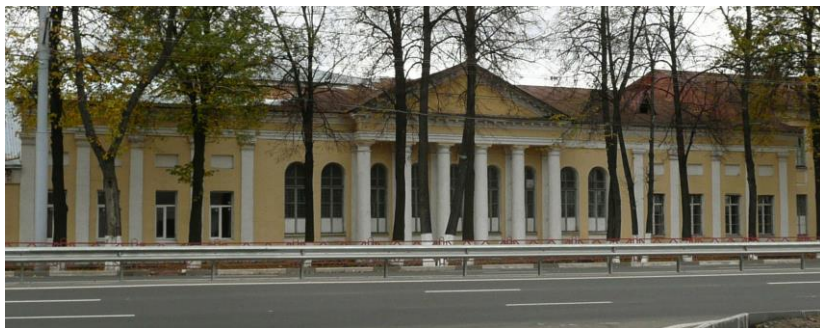
Здание казармы ЯВАШ (бывший кадетский корпус) на улице Московской в Ярославле