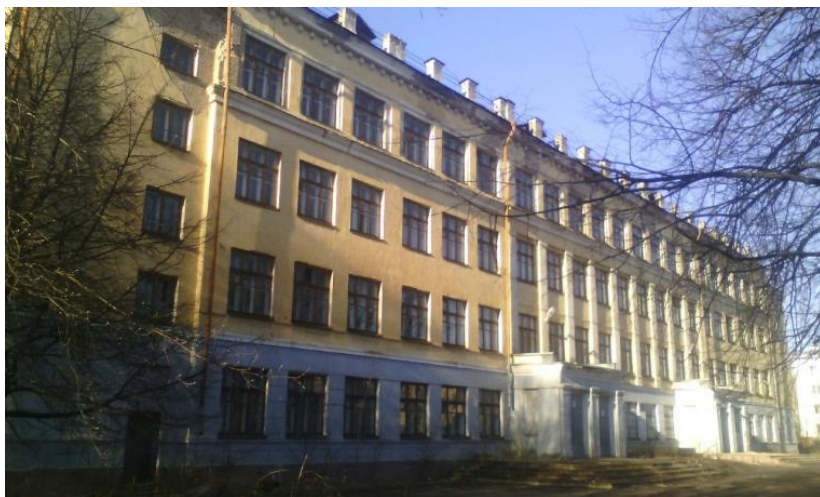
Учебное здание ЯВАШ (после войны – школа №53) на улице Емельяна Ярославского в Ярославле