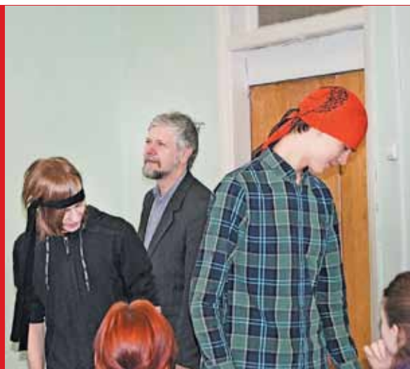
СОГЛАСЕН ЛИ ПРЕПОДАВАТЕЛЬ?