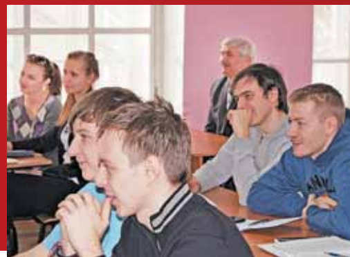
РЕКТОР ВСПОМИНАЕТ СТМОВСКУЮ МОЛОДОСТЬ