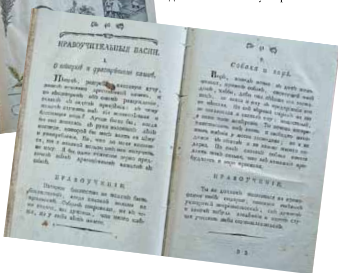
СТРАНИЦЫ НОВОЙ РОССИЙСКОЙ АЗБУКИ МОСКВА 1809 г.