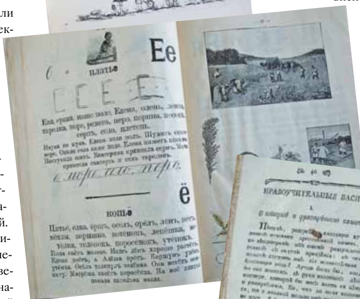
БУКВАРЬ В.Н. ПАНОВА, Н.И. СОКОЛОВА МОСКВА 1909 г.