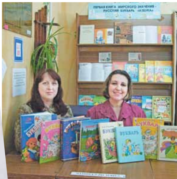
РОЗОВАЯ АЗБУКА Е.Е. СОЛОВЬЕВОЙ. 1918 г.

Разложив азбуки и буквари в хронологической последовательности, можно было проследить не только историю букваристики в России, но и историю самого народа, ведь