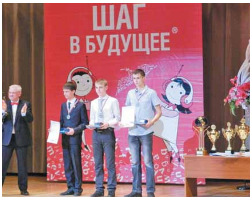
▲ Награждение победителей Форума