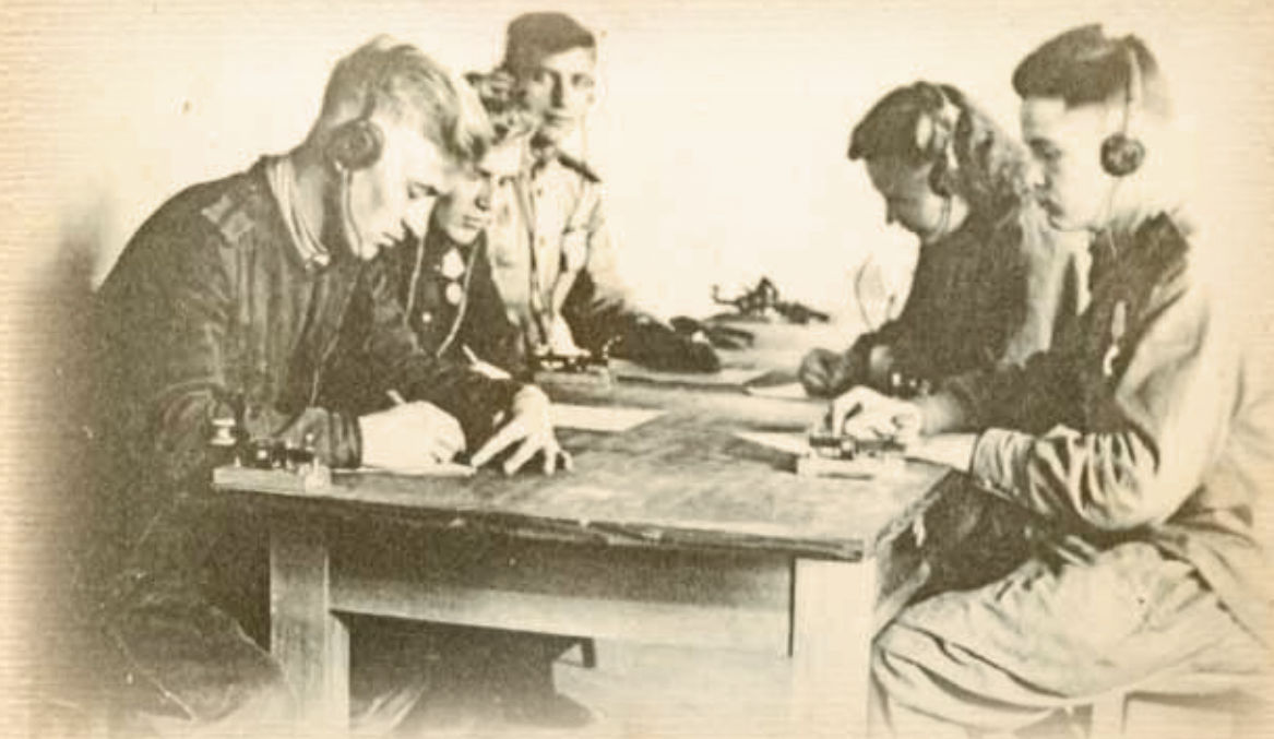
▲ Вечерняя тренировка радистов. Самара, 1943 год