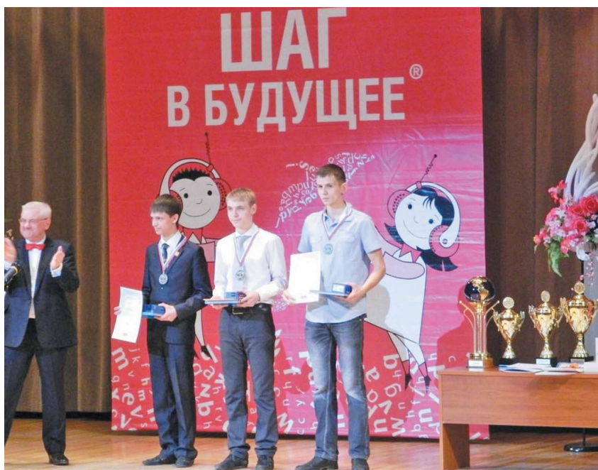
▲ Награждение победителей Форума