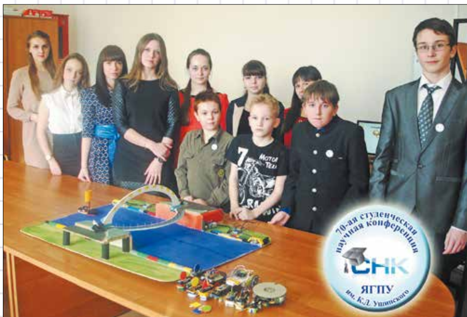
▼ Научная секция СИБ

ли своих виброботов, созданных по принципам BEAM – робототехники.